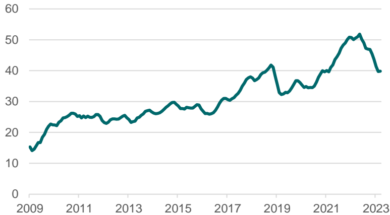
Wereldwijde omzetgroei semiconductors jaar-op-jaar jan 2009 – mrt 2023